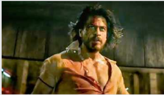
BADSHAH OF BOLLYWOOD. Analysts believe the movie will rake in the moolah and has the potential to become the highest Hindi grosser post-Covid

All eyes are on Shah Rukh Khan-starrer Pathaan slated to be released on Wednesday. Movie exhibition industry has pinned its hopes on the big budget flick to help speed up the recovery of Hindi movie industry to pre-pandemic levels. The movie is already witnessing strong advance booking trends for the Republic Day long weekend as Khan will be seen on the big screen after a four-year hiatus.