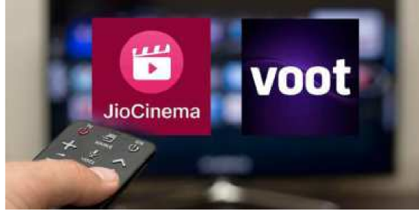
PADDING UP. Viacom18 has acquired the digital rights for IPL 2023-2027 for ₹20,500 crore.

Viacom18 is set to merge its flagship OTT platform Voot with JioCinema to live-stream the Indian Premier League. Sources close to the company told businessline that Viacom18 will merge the two platforms.